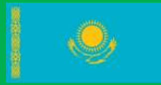
カザフスタン共和国 (Republic of Kazakhstan)