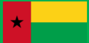
ギニアビサウ共和国 (Guinea-Bissau)