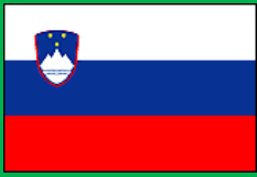
スロベニア共和国