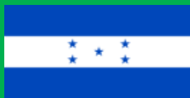
ホンジュラス共和国 (República de Honduras)