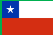
チリ共和国 (República de Chile)