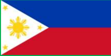
フィリピン共和国 (Philippines)