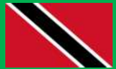
トリニダード・トバゴ (Trinidad and Tobago)