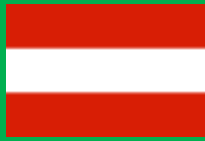
オーストリア共和国 (Austria)