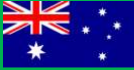
オーストラリア連邦 (Ausutralia)