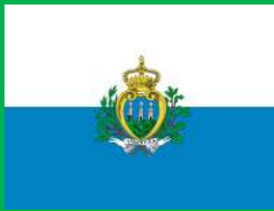
サンマリノ共和国 (San Marino)