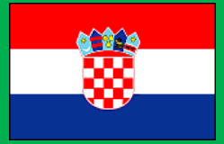
クロアチア共和国

( Republika Slovenija ) ( Repubblica Italiana ) ( Republik Österreich ) ( Magyar Köztársaság ) ( Republika Hrvatska )