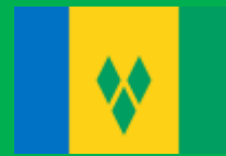
セントビンセント・グレナディン諸島 (Saint Vincent and the Grenadines)