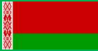
ベラルーシ共和国 (Republic of Belarus)