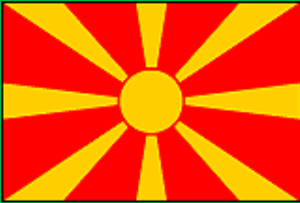
マケドニア共和国