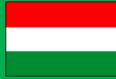
ハンガリー共和国