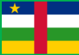
中央アフリカ共和国 (Central African Republic)