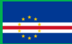
カーボベルデ共和国 (Cape Verde)