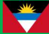
アンティグア・バングーダ (Antigua and Barbuda)