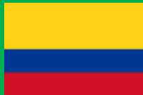
コロンビア共和国 (República de Colombia)