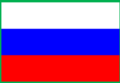
ロシア連邦 (Russian Federation)