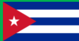
キューバ共和国 (República de Cuba)