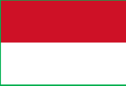
インドネシア共和国 (Indonesia)