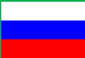
ロシア連邦 (Russian Federation)