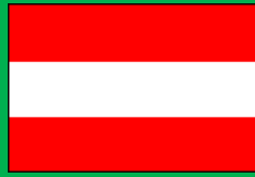
オーストリア共和国