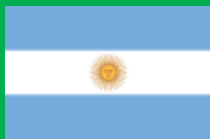
アルゼンチン共和国 (República Argentina)