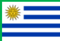
ウルグアイ東方共和国 (República Oriental del Uruguay)