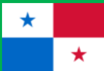
パナマ共和国 (República de Panamá)