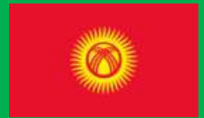
キルギス共和国 (Kirghiz Republic)