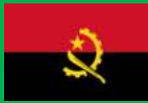
アンゴラ共和国 (Republic of Angola)