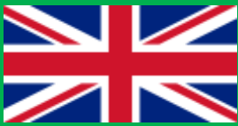
イギリス (United Kingdom)