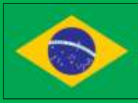
ブラジル連邦共和国 (Brazil)