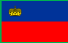
リヒタンシュタイン公国 (Liechtenstein)