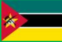
モザンビーク共和国 (Republic of Mozambique)