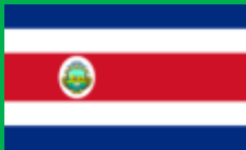
コスタリカ共和国 (República de Costa Rica)